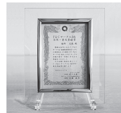
『QCサークル』誌活用・普及貢献賞 楯