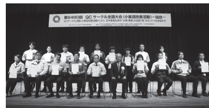
第6480回QCサークル全国大会―仙台― QCサークル感動賞記念撮影